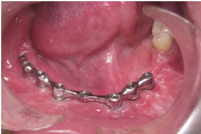
Slika 4: Prečka na šest implantata.