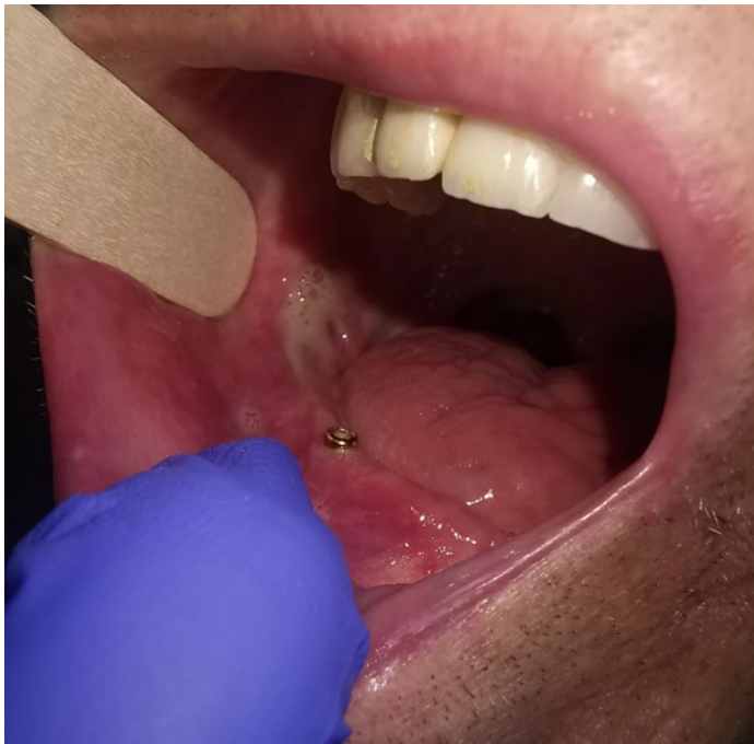
Slika 1: Osteoradionekroza.

Osteoradionekroza se razvija djelovanjem terapijskih doza zračenja, a rizik za njezin nastanak je doživotan. Mogućnost razvoja ORN odnosi se samo na zračene kosti. Dakle, ukoliko čeljusne kosti nisu bile zračene prilikom radioterapije drugih malignih bolesti, one onda nisu u opasnosti. Kod primljenih doza zračenja iznad 60 Gy, rizik značajno raste, dok je on puno manji za doze ispod 50Gy (12). Razlog tomu je osjetljivost osteocita na visoke doze zračenja. Planocelularni karcinom, najčešći karcinom glave i vrata, pokazuje rezistenciju na terapiju nižu od 65 Gy, stoga treba obratiti pozornost na to da su onkološki pacijenti sa poviješću radioterapije, uglavnom bili izloženi višim, rizičnim dozama zračenja. Osim same doze zračenja, rizik za nastanak izrazito je povećan izlaganjem zračene kosti traumi, poput kirurškog zahvata i vađenja zuba, budući da osteoblasti, koji su zaduženi za cijeljenje, postradijacijski ne mogu izvršiti svoju zadaću. Kirurškim zahvatom opasnost od razvoja ORN povećava se za 50% (15). Iz tog se razloga nastoje izbjeći ekstrakcije zuba tijekom i nakon radioterapije. Osteoradionekroza može nastati spontano ili izlaganjem traumi. Na slici 1. vidi se početni stadij razvoja osteoradionekroze u stražnjem segmentu mandibule, unatoč postavi implantata u frontalnom djelu.