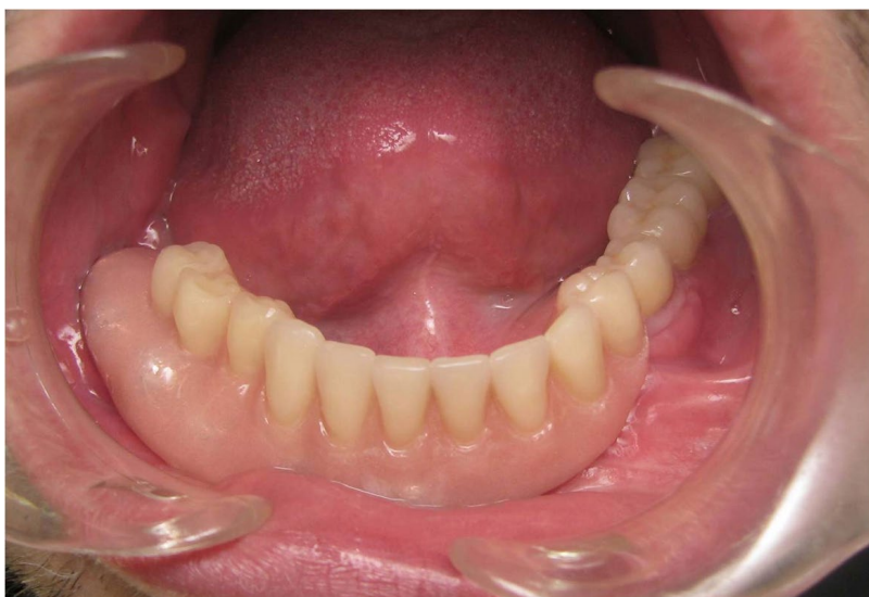
Slika 5: Gotova pokrovna proteza.