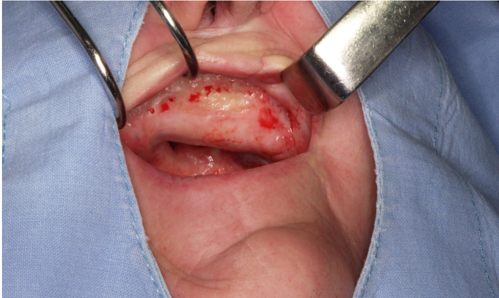
Slika 2: Maksila rekonstruirana slobodnim fibula režnjem.