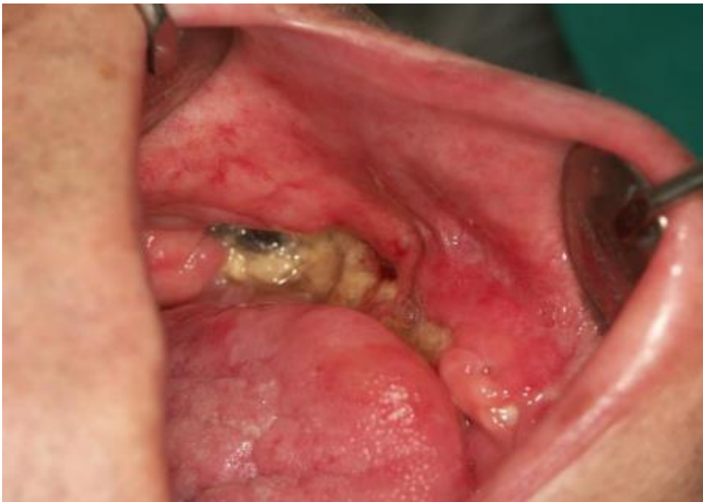
Slika 6. Stadij II osteoradionekroze – eksponirana kortikalna i medularna kost. Preuzeto iz arhiva Zavoda za oralnu medicinu Stomatološkog fakulteta