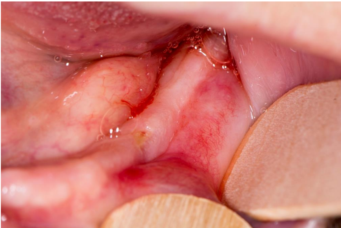
Slika 1. MRONJ stadij 1.

U ovom stadiju dolazi do klinički eksponirane nekrotične kosti ili fistule koja se stvara iz kosti, ali pacijenti nemaju simptoma ili akutnih znakova infekcije. Terapija je usmjerena na praćenje lezije, a ako se pojave sekvestri nekrotične kosti ili oštri rubovi, potrebno ih je ukloniti. Pacijentovo stanje potrebno je pratiti, kao i educirati ga o važnosti učestalih kontrola (5).