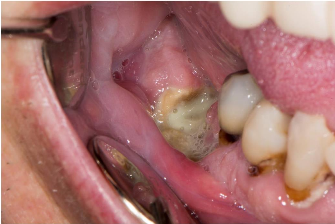
Slika 3. MRONJ stadij 2.