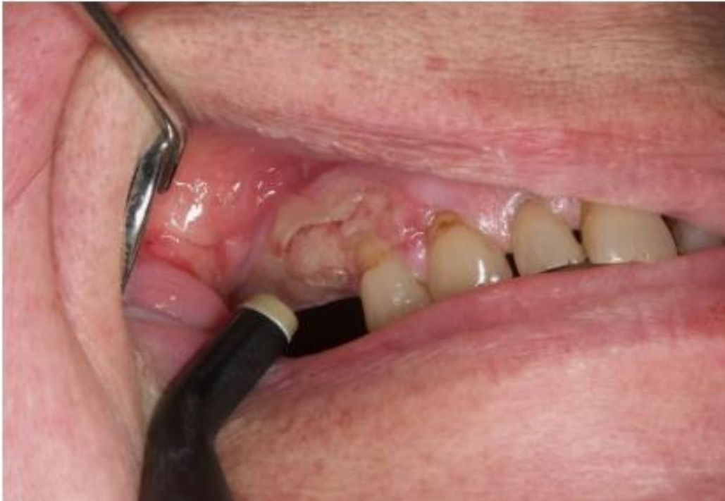
Slika 5. Stadij I osteoradionekroze – eksponirana kortikalna kost.