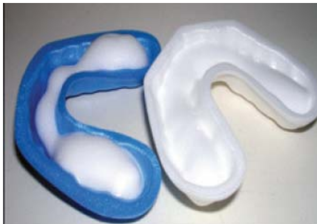
Slika 12. Žlica za fluoridaciju gelom. Preuzeto (30)

aplikaciju kada se najbolji rezultati fluoridacije postižu redovitom uporabom niskih doza (5).