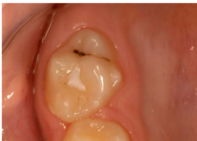
Slika 7. Pečatni ispun.