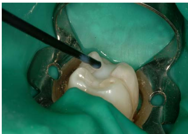
Slika 4. Aplikacija smole za pečačenje.

Materijal za pečačenje aplicira se prema uputama proizvođača. Ti materijali često na vrhu imaju tanke kanile koje omogućuju lakše apliciranje u fisure i time bolju raspodjelu materijala po fisuri. Bitno je u potpunosti prekriti fisure, bez prepunjavanja i produživanja. Aplicirani materijal se polimerizira plavim polimerizacijskim svjetlom prema uputama proizvođača.