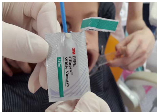
Slika 14. Fluoridni lak Clinpro White Varnish.