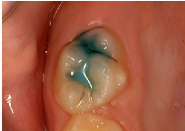
Slika 6. Jetkanje.

i tehnika mikroabrazije zrakom koja čisti organski sadržaj jamica i fisura prije samog pečačenja (14). Preventivnom restauracijom se odstranjuje meko karijesno tkivo u dijelovima fisura, s minimalnim gubitkom čvrstog tkiva, a to uključuje prevenciju i zaustavljanje karijesa u ostatku fisura, aplikacijom restaurativnog materijala i pečatnog materijala koji prekriva sve dijelove fisura (4). Sredstvo za pečačenje stavlja se preko polimeriziranog materijala i preko preostalih fisura, kao zaštita od nastanka karijesa te štiti kompozitni ispun od abrazije (13).