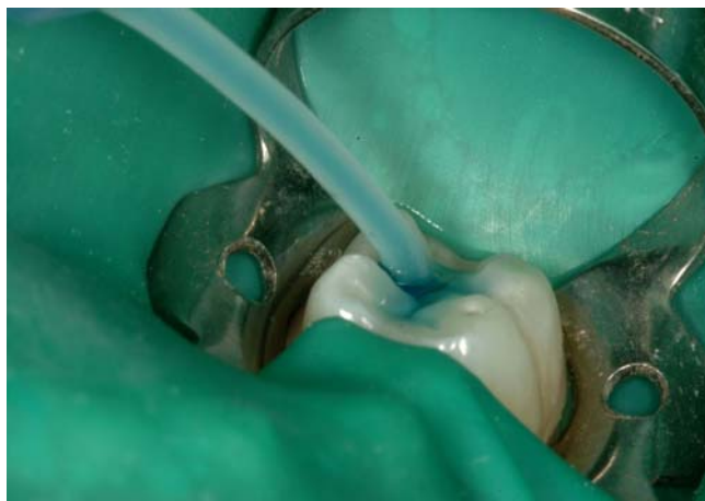
Slika 3. Jetkanje.