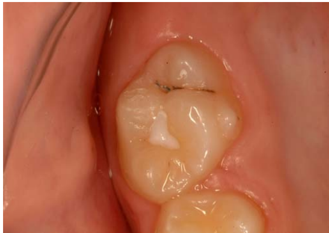
Slika 9. Pečatni ispun.