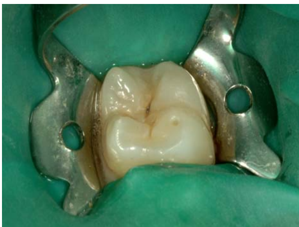
Slika 1. Selekcija zuba i izolacija.

Zub za pečaćenje mora biti izoliran da se spriječi mogućnost kontaminacije slinom i bilo kakvim drugim tjelesnim tekućinama. Izolacija radnog polja uspostavlja se svicima staničevine i sisaljkom na negativan tlak, a može se koristiti i koferdam.