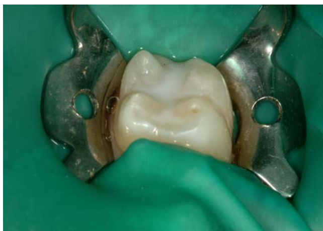
Slika 5. Kontrola pečata.

Kontrola pečata obavlja se sondom i ogledalom da bi se utvrdile moguće nepravilnosti u materijalu, kao što su mjehurići zraka ili nedovoljno zapečaćene fisure. Reaplikaciju materijala moguće je izvršiti u ovoj fazi dok još postoji suho radno polje i zub nije kontaminiran tjelesnim tekućinama.