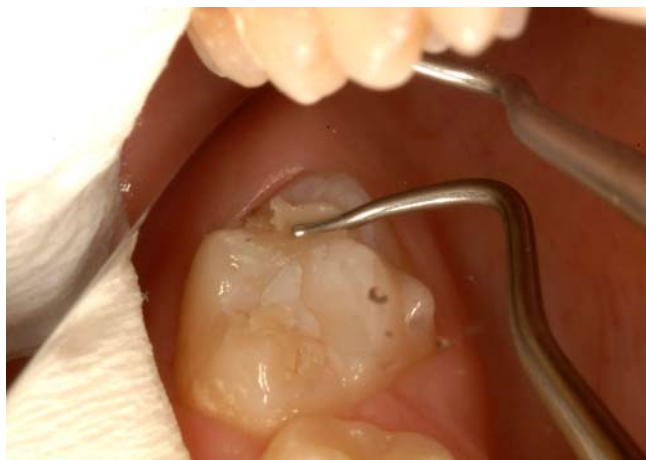
Slika 10. Pečatni ispun.