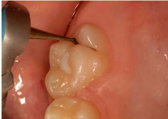
Slika 8. Pečatni ispun.