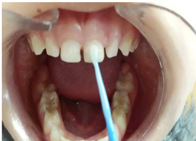
Slika 15. Aplikacija fluoridnog laka.