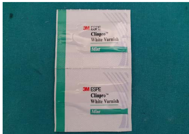
Slika 13. Fluoridni lak Clinpro White Varnish.