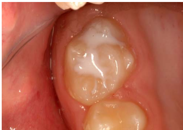
Slika 11. Pečatni ispun.