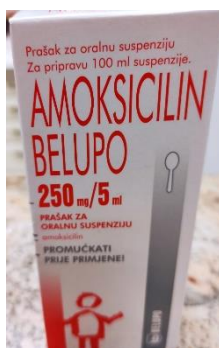
Slika 1. Amoksicilin prašak za oralnu suspenziju

Doziranje za odrasle i adolescente težine >40 kg : 250-500 mg svakih 8 sati