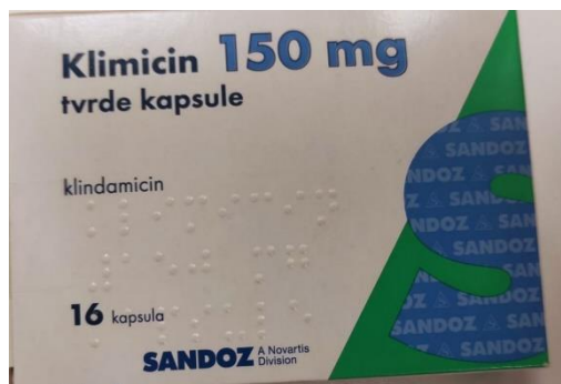
Slika 4. Klimicin kapsule