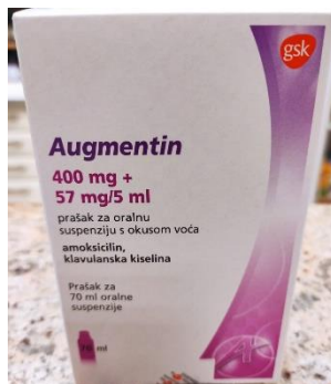
Slika 2. Augmentin prašak za oralnu suspenziju s okusom voća