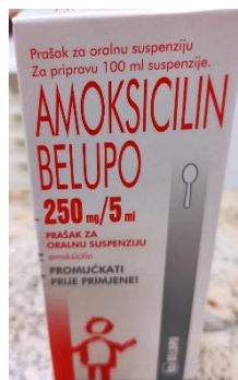
Slika 1. Amoksicilin prašak za oralnu suspenziju

Doziranje za odrasle i adolescente težine >40 kg : 250-500 mg svakih 8 sati