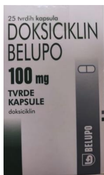
Slika 5. Doksiciklin kapsule

Odrasli i djeca starija od 8 godina s >45 kg: 100mg svakih 12 sati prvoga dana, zatim 100 mg jedanput dnevno; za teške infekcije 100 mg svakih 12 sati do izlječenja infekcije