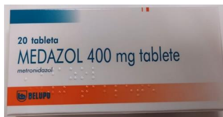
Slika 7. Medazol tablete

U slučaju agresivnih infekcija: 250 mg tri puta na dan u kombinaciji s amoksicilinom (250-375 mg tri puta na dan) u trajanju 7-10 dana