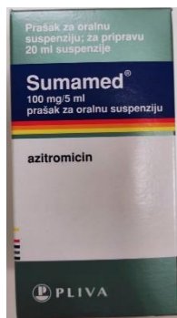
Slika 6. Sumamed prášak za oralnu suspenziju

Odrasli i djeca starija od 16 godina: 500 mg jednokratna doza prvi dan, sljedećih 2-5 dana 250mg jedanput na dan.