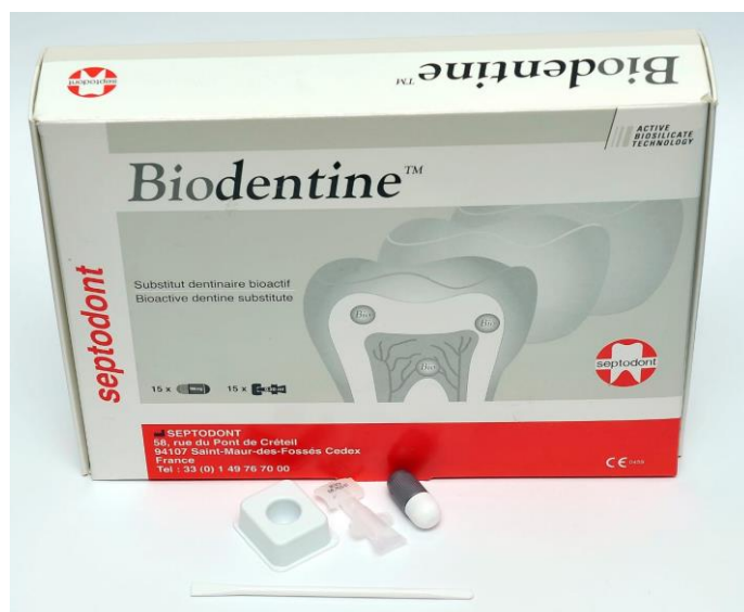
Slika 7. Sadržaj pakiranja Biodentina – inkapsulirani prašak i tekućina koja se dodaje u kapsulu prije trituracije

kolagenih fibrila te tako stvaraju kemijsku i mehaničku vezu i smanjuju rubno propuštanje (35). Također, prisutstvom kalcijevog karbonata smanjuje se ukupni udio vode u smjesi koja je nužna za stvrdnjavanje, ali ujedno i usporava sami proces (42). Utjecaj na vrijeme stvrdnjavanja ima i omjer silikata. Naime, dikalcijev silikat koji je u Biodentinu izostavljen, a nalazi se npr. u MTA-u, sporo se hidrira što produžava potrebno vrijeme stvrdnjavanja i utječe na homogenost smjese. Homogenija smjesa biodentina se bolje adaptira uz marginalne stjenke i samim time bolje brtvi. Kombinacija svih tih faktora čini biodentin superiornijim materijalom od MTA-a što se tiče sposobnosti brtvljenja (31). Dodatna prednost biodentina nad MTA-om u smislu materijala za retrogradno punjenje je ta što dolazi u inkapsuliranim dozama praška koje se tritiriraju nakon dodavanja pet kapljica tekućine (slika 7) (20).