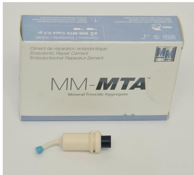
Slika 5. Pakiranje i kapsula MM-MTA-a koja sadrži komponente koje se prije upotrebe miješaju u amalgamatoru

Jedna od varijacija MTA proizvođača Micro Mega – MM MTA - u svome sastavu sadrži i kalcijev karbonat koji služi kao akcelerator i time vrijeme stvrdnjavanja smanjuje na svega 20 minuta. Dolazi u kapsulama koje se miješaju u amalgamatoru što pojednostavljuje proces aplikacije i garantira homogenu teksturu (slika 5). Vodeći je materijal od navedenih po količini otpuštenih kalcijevih iona (40).