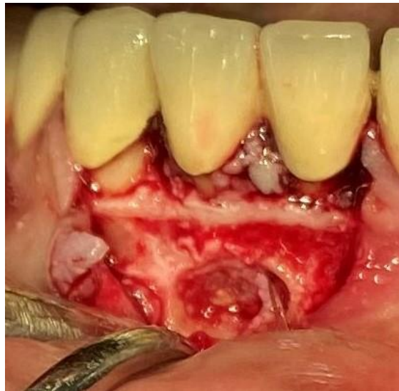
Slika 2. Klinički slučaj: Odizanje režnja nakon incizije mekog tkiva i prikazivanje kosti i periapikalnog procesa u području periapeksa zuba 42

Nakon aplikacije anestetika, incizije mekog tkiva i odizanja režnja (slika 2), pristupa se osteotomiji čija opsežnost ovisi o veličini defekta kosti koji je nastao uslijed postojanja periapikalnog procesa.