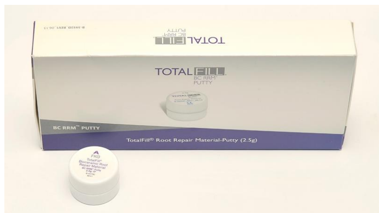
Slika 8. Pakiranje Total Fill RRM-a - materijal je unaprijed zamiješan i spreman za upotrebu u obliku paste

Endosequence Root Repair Material (Brassler USA, Savannah, SAD), poznat i kao Total Fill RRM (Ivoclar Vivadent, Schan, Lichtenstein) još je jedan od materijala na bazi kalcijevog silikata, unaprijed zamiješan i dostupan u kitastoj konzistenciji u obliku paste (Slika 8). Sastoji se od trikalcijevih silikata, cirkonijevog oksida, tantalovog peroksida, kalcijevog fosfata i čestica punila. Ovaj biokeramički materijal ima izvrsna fizikalna i biološka svojstva te je jednostavan za rukovanje. Ima visoki pH, hidrofilan je, netopljiv, radioopak i ne sadrži aluminij. Stvrdnjava se u prisutnosti vlage, te ga to čini izvrsnim materijalom za upotrebu u endo-kirurgiji. U teoriji je i sama tekućina koja se nalazi u dentinskim kanalčićima dovoljna za potpuno stvrdnjavanje ERRM-a. Način rukovanja je isti kao i kod Bioaggregate, a mnogo jednostavniji nego kod MTA (35).