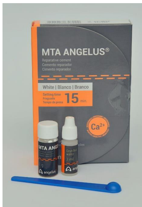
Slika 6: Sadržaj pakiranja MTA Angelusa – prašak i tekućina koji se ručno miješaju