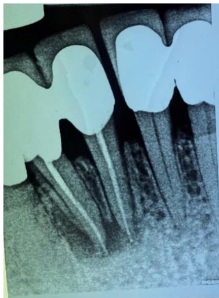
Slika 1. Klinički slučaj: zub 42 na kojem perzistira periapikalni proces usprkos provedenoj endodontskoj terapiji