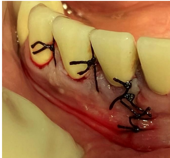
Slika 4. Klinički slučaj: Šivanje mekih tkiva nakon provedene apikotomije

Uspjeh zahvata ovisi ponajviše o dva čimbenika – uklanjanju nekrotičnog, odnosno inficiranog tkiva i učinkovitom brtvljenju korijenskog kanala (10). Stopa uspješnosti kontinuirano raste uvođenjem moderne tehnologije poput lupa, mikroskopa i ultrasoničnih nastavaka te trenutno iznosi između 74% i 92% (11), no uvjerljivo najistraživaniji čimbenik uspješnosti endo-kirurškog zahvata su materijali koji se koriste za retrogradno punjenje. Budući da sama kiretaža periapikalne lezije uklanja posljedicu, ali ne i sam uzrok apikalnog propuštanja, uspješnost zahvata ovisi o materijalu koji osigurava apikalno brtvljenje, a trebao bi biti dimenzijski stabilan, vezati se na stijenke korijenskog kanala, djelovati antibakterijski, omogućiti regeneraciju kosti te naposljetku neće biti toksičan za organizam (8).