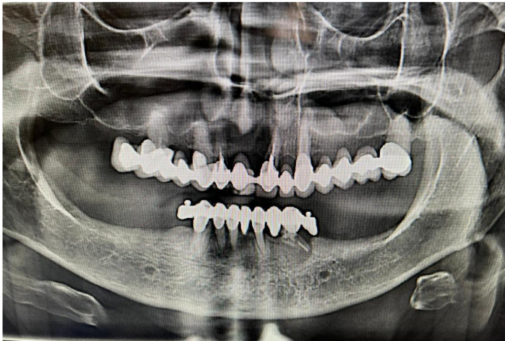
Slika 1. Ortopantomogramom imamo najbolji uvid u kompletno stanje usne šupljine pacijenta.

Osim detaljne anamneze, kliničkog pregleda, radioloških snimki, s pacijentom je potrebno obaviti razgovor gdje mu se mora dati realan prikaz o uspješnosti, komplikacijama, riziku, troškovima, mogućnosti održavanja svake pojedine terapije, nakon čega bi pacijent vrlo jasno trebao iznijeti svoja očekivanja od terapije. U obzir naravno moramo uzeti i financijski aspekt terapije jer svako kompliciranije liječenje za pacijenta predstavlja dodatni trošak (3). Vrlo je važno u razgovoru procijeniti pacijentovo psihičko stanje te motiviranost za odabranu terapiju (14).