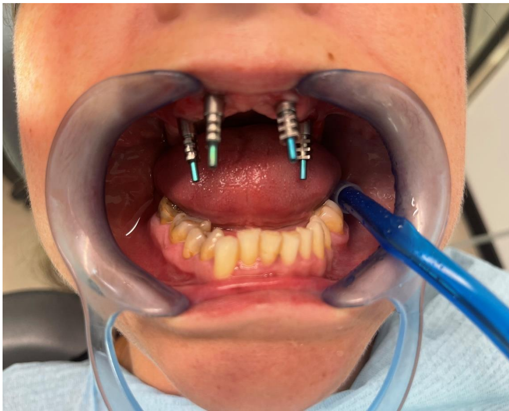
SLIKA 5. Postava transfera za uzimanje otiska.

perforacijama u području implantata. U otvorenoj tehnici transfer izlazi kroz perforaciju na žlici te se nakon stvrdnjavanja materijala transfer odviše i žlica se izvadi iz usta, a dio transfera ostaje u otisku te se takav šalje u dentalni laboratorij. Kod zatvorene tehnike, transferi su vrlo kratki te nakon što se uviju u implantat, otiskuju se kao da su zubi. Potom se transfer odvija te se odvojeno od uzetog otiska šalje u laboratorij. Za zatvorenu tehniku nisu potrebne individualizirane žlice ili žlice s perforacijama već se uzima obična standardizirana žlica. Drugi način otiskivanja se preporučuje kod nadogradnji na vijčanu vezu pri čemu se nadogradnja stavi u usta, stegne i tako ostaje do kraja terapija. U nju je potrebno staviti drugačije transfere, ali postupak otiskivanja je isti kao i kod uzimanja otiska kod prve tehnike (36).