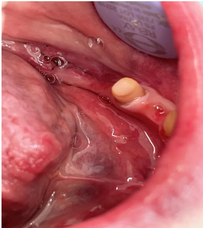
SLIKA 3. Izbrušeni kompromitirani zub.

Prilikom preparacije mogu se oštetiti meka tkiva oko brušenog zuba. Takva oštećenja mogu biti privremena i brzo zacijeliti, ali moguće su i trajne posljedice u obliku upale i recesije. S obzirom na smještaj preparacije postoje preparacije iznad, u i ispod razine gingive. Kada je god moguće potrebno je rub preparacije dignuti iznad razine gingive jer je higijenski najprihvatljivija (17).