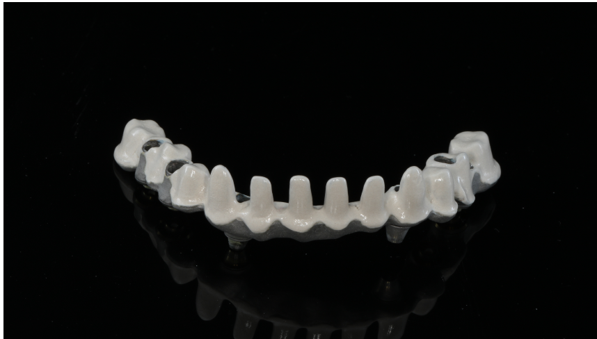
Slika 5. CoCr metalna jezgra obložena opakerom.

Digitalne tehnologije postale su standard proizvodnje metalnih nadomjestaka izrađenih od kobalt-krom legure. Danas je moguće proizvesti osnovnu metalnu konstrukciju i za mostove većih raspona. Fizička i mehanička svojstva mogu se usporediti s onima konvencionalne izrade, a rubni dosjed pokazao se još boljim (45). Keramika se lako nanosi na površinu metala radi hrapavosti koja je pogodna za nanošenje opakera.