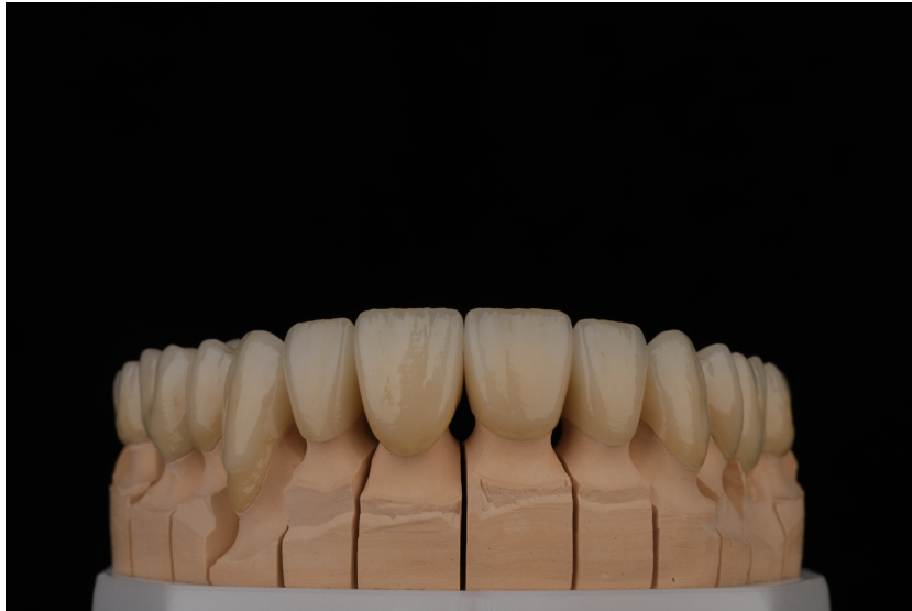
Slika 2. Cirkon-oksida jezgra obložena staklokeramikom.

generacija cirkonijeva oksida bila je potpuno mutna i morala se presvlačiti obložnom keramikom kako bi postala estetski prihvatljiva. Odlamanje obložne keramike predstavljalo je veliki problem, dok nisu razvijeni odgovarajući oblici jezgre koja podupire obložnu keramiku te je uvedeno postupno hlađenje nadomjeska nakon sinteriranja. Time je značajno smanjena incidencija lomova (27). Cirkonij-oksida jezgra rijetko je pucala pa je tako začeta ideja o monolitnim cirkonij-oksidskim nadomjescima.