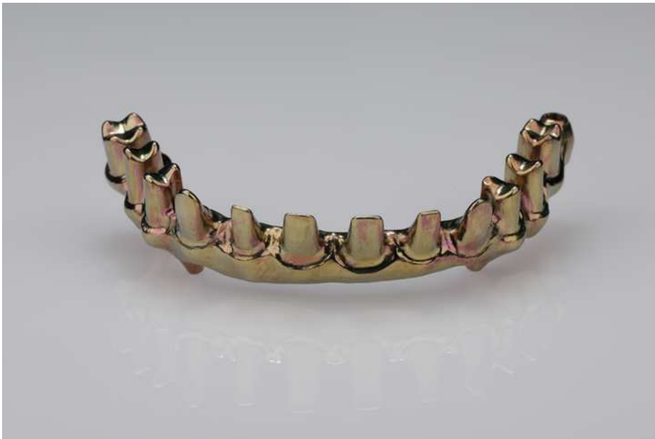
Slika 1. Metalna baza od titanija.

Titanijski blokovi mogu se upotrijebiti za izradu individualnih titanijskih nadogradnji koje se mogu dodatno obojiti za izazovnije estetske slučajeve. Plemenite i visoke plemenite legure mogu se glodati čime se eliminiraju problemi vezani uz ulaganje, izgaranje i lijevanje. Brže se postižu rezultati uz manje napora nego kod konvencionalnih metoda.