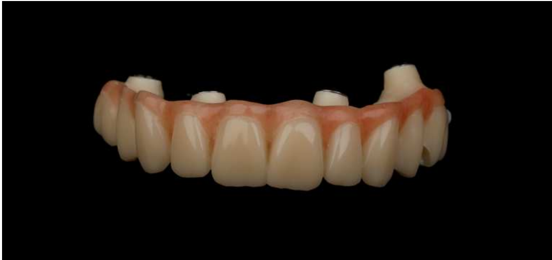
Slika 4. PMMA privremeni most na vijak. Preuzeto uz dopuštenje autora: Luka Stojić, dr. med. dent.