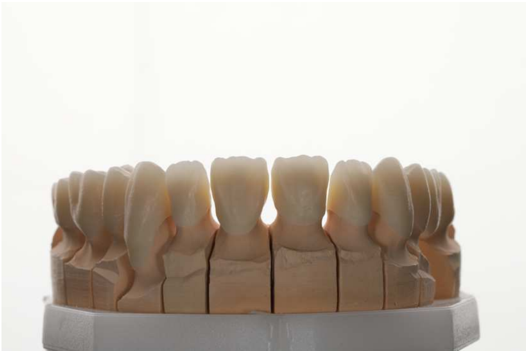
Slika 6. Cirkonij-oksida jezgra.

njihovu primjenu u estetski zahtjevnim slučajevima, što je potaknulo razvoj transludentnijih oblika cirkonijeva oksida.